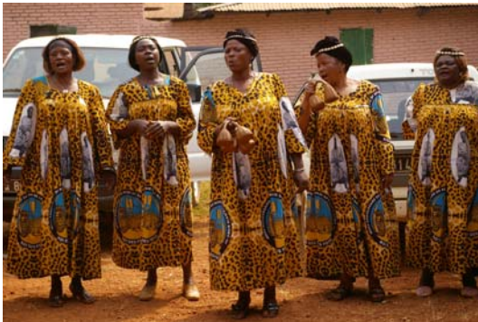
Reines portant le pagne de la chefferie Foto

Aujourd'hui, ce que l'on désigne par « pagne » est une pièce de coton de 6 yards de long (5,48m), fabriquée de manière artisanale ou industrielle, aux motifs colorés, d'inspiration traditionnelle, ethnique, contemporaine ou commerciale puisque le pagne est aussi un moyen de faire de la communication. En effet, beaucoup d'ethnies ont un pagne particulier ; de même pour les associations de femmes, groupes religieux, personnels d'entreprise. Il peut être un instrument de propagande politique.