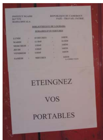
Les horaires de la bibliothèque