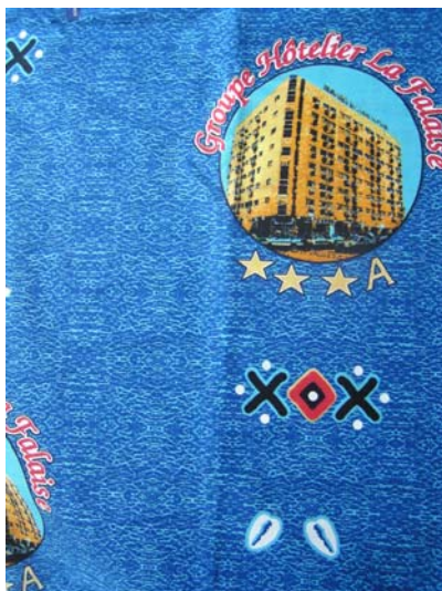
Pagne à l'enseigne d'un hôtel