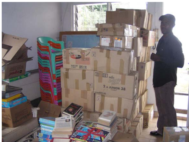
Les cartons bien arrivés à Douala !