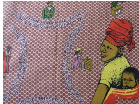
Pagne de la Journée de la Femme 2008