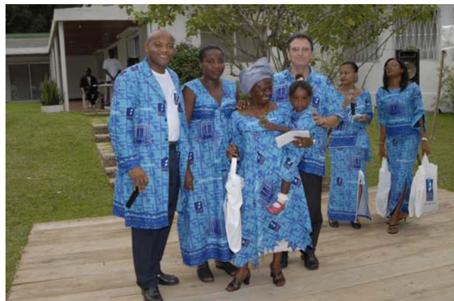
Pagne à l'enseigne d'une banque